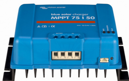
Contrôleur de charge solaire MPPT 75/50