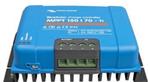
Contrôleur de charge solaire MPPT 150/70-Tr