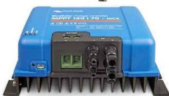
Contrôleur de charge solaire MPPT 150/70 MC4